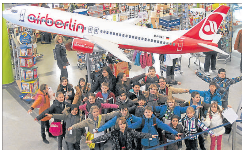
Ihre Flügel habe sie schon ausgebreitet: Die Schülerreporter der Klasse 4b der Blücherschule Gütersloh erforschen den Flughafen Paderborn-Lippstadt in Büren.